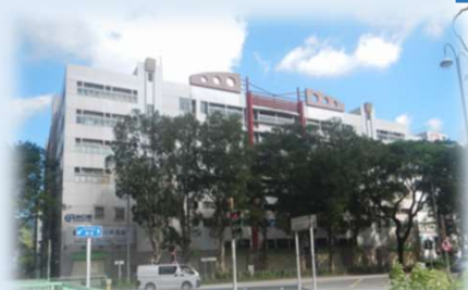
Ally PCB (HongKong)