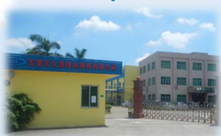
DongGuan HRSC PCB